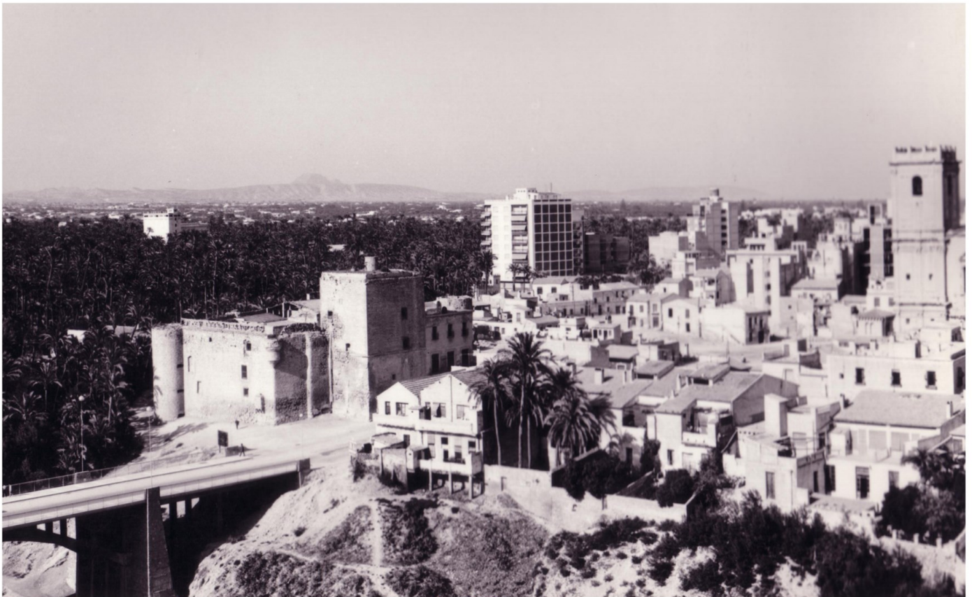
Zona de Traspalacio y Parque Municipal. 1972