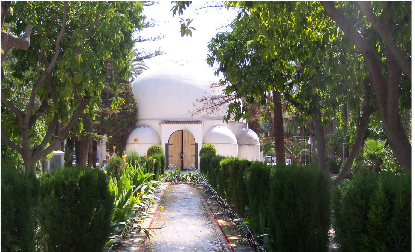
Centro de Visitantes, Parque Municipal, 2008