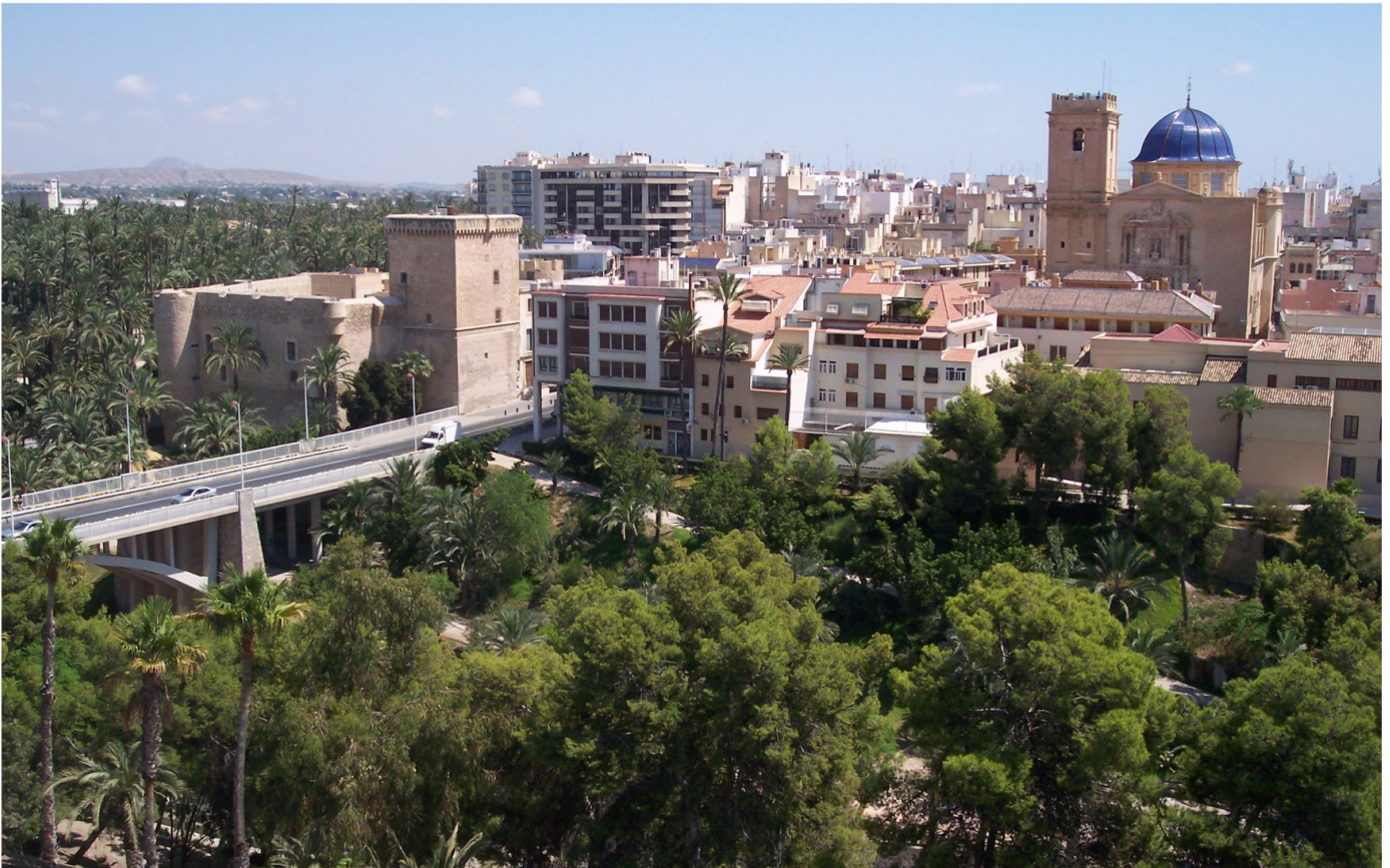
Basílica de Santa María, Zona de Traspalacio y Parque municipal, 2008