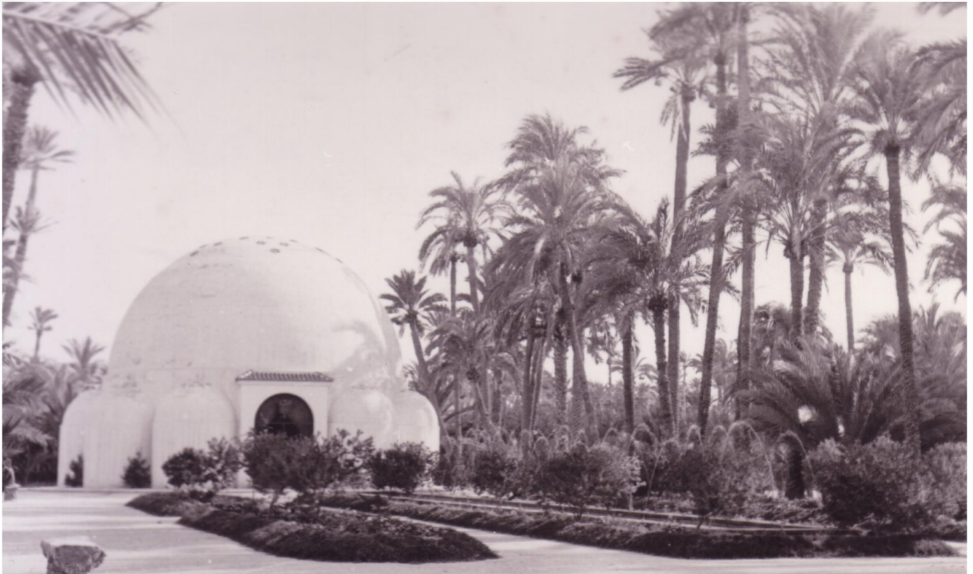
Pabellón Central de la Exposición Industrial. 1948